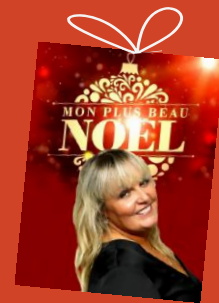
Mon plus beau Noël