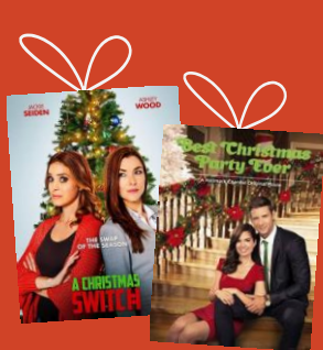
Téléfilms de Noël

Chaque année le Père Noël réjouit les téléspectateurs d'Antenne Réunion avec une programmation spécifique pour les fêtes.