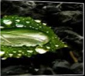
Fessibe de Pivote